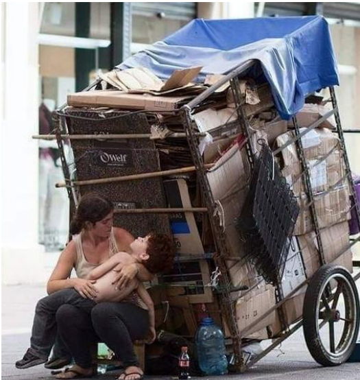
Piedad siglo XXI

Por esa razón el presente no se trata de un trabajo que procura renegar de las raíces, sino que es una reflexión para buscar razones y explicaciones a los conflictos desde una óptica que tenga presente determinados aspectos que están por fuera de la matriz civilizadora que heredamos. Se trata, en definitiva, de lograr la capacidad y preparación necesarias para aceptar visiones diferentes y no creer que hay cosas que son inmutables, que no se pueden modificar y que, ni siquiera, se puede cometer la “imprudencia” de mencionar o imaginar que podrían ser de otra forma.